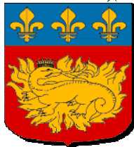
Blason des O'Connell

de gueules à la salamandre couronnée d'or sur un brasier du même, au chef cousu d'azur chargé de trois fleurs de lys aussi d'or